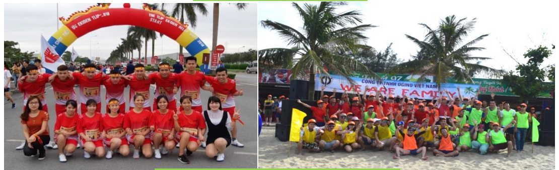
Hoạt động văn hóa thể thao